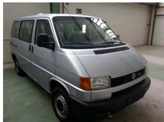
Kat. Nr.: 5