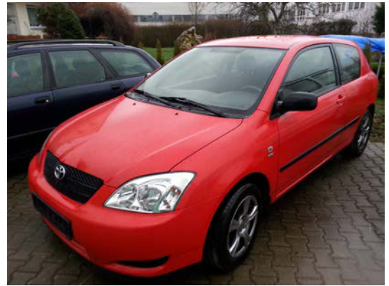
Kat. Nr.: 26