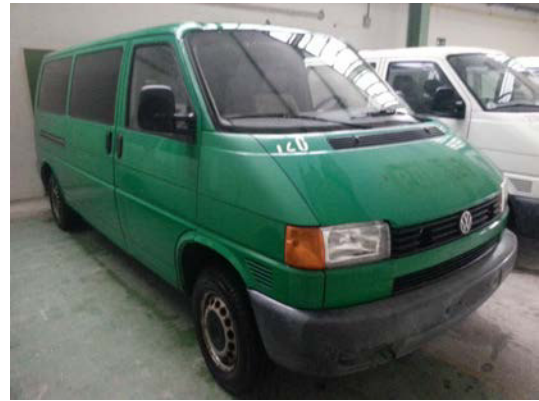
Kat. Nr.: 9