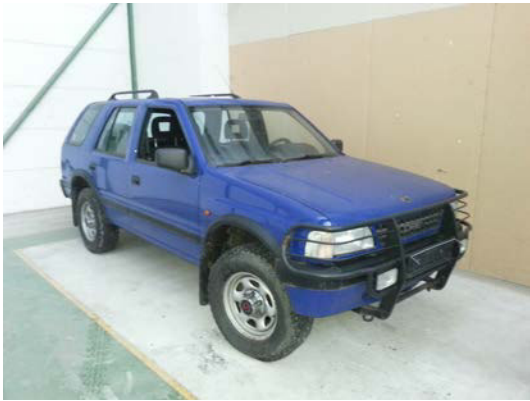
Kat. Nr.: 16