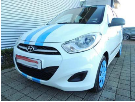
Kat. Nr.: 31