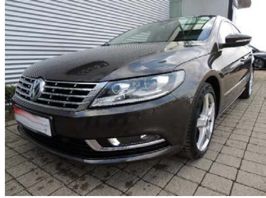
Kat. Nr.: 29