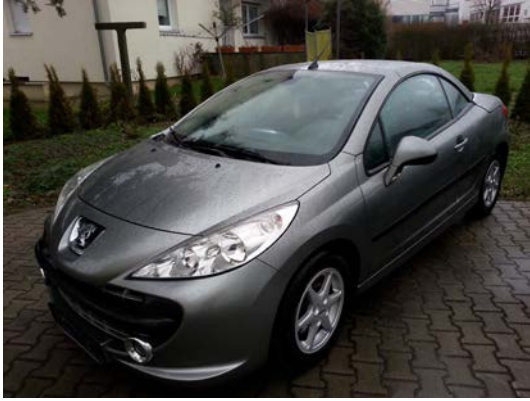
Kat. Nr.: 28