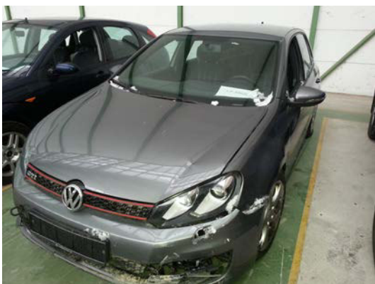
Kat. Nr.: 14