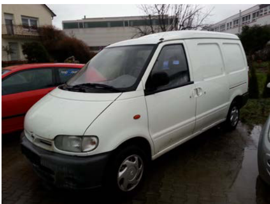
Kat. Nr.: 24