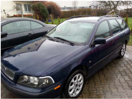
Kat. Nr.: 27