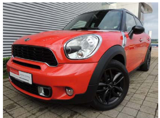
Kat. Nr.: 30