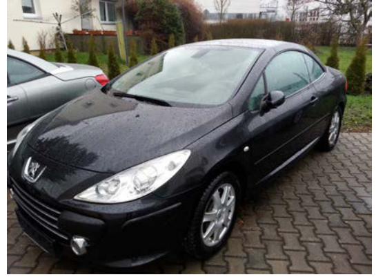
Kat. Nr.: 25